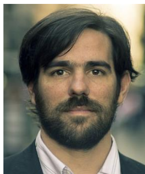
NICOLÁS DEL CAÑO