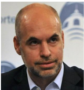
HORACIO RODRIGUEZ LARRETA