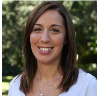
MARIA EUGENIA VIDAL