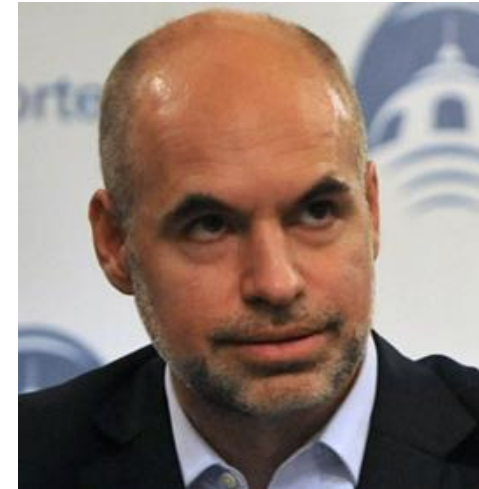
HORACIO RODRIGUEZ LARRETA