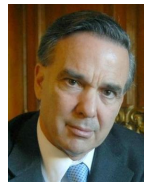
MIGUEL ÁNGEL PICHETTO