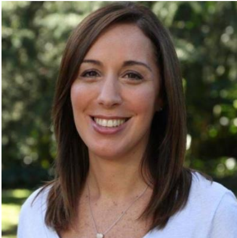
MARÍA EUGENIA VIDAL

También reportan que podrían llegar a votar a (...):