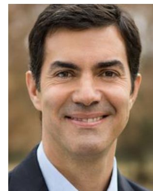
JUAN MANUEL URTUBEY